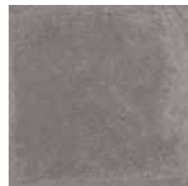
J84019 34x34 (13 1/2"x13 1/2")