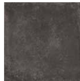
J84020 34x34 (13 1/2"x13 1/2")