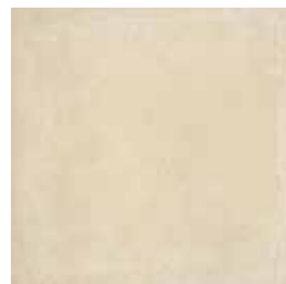
J84021 34x34 (13 1/2"x13 1/2")